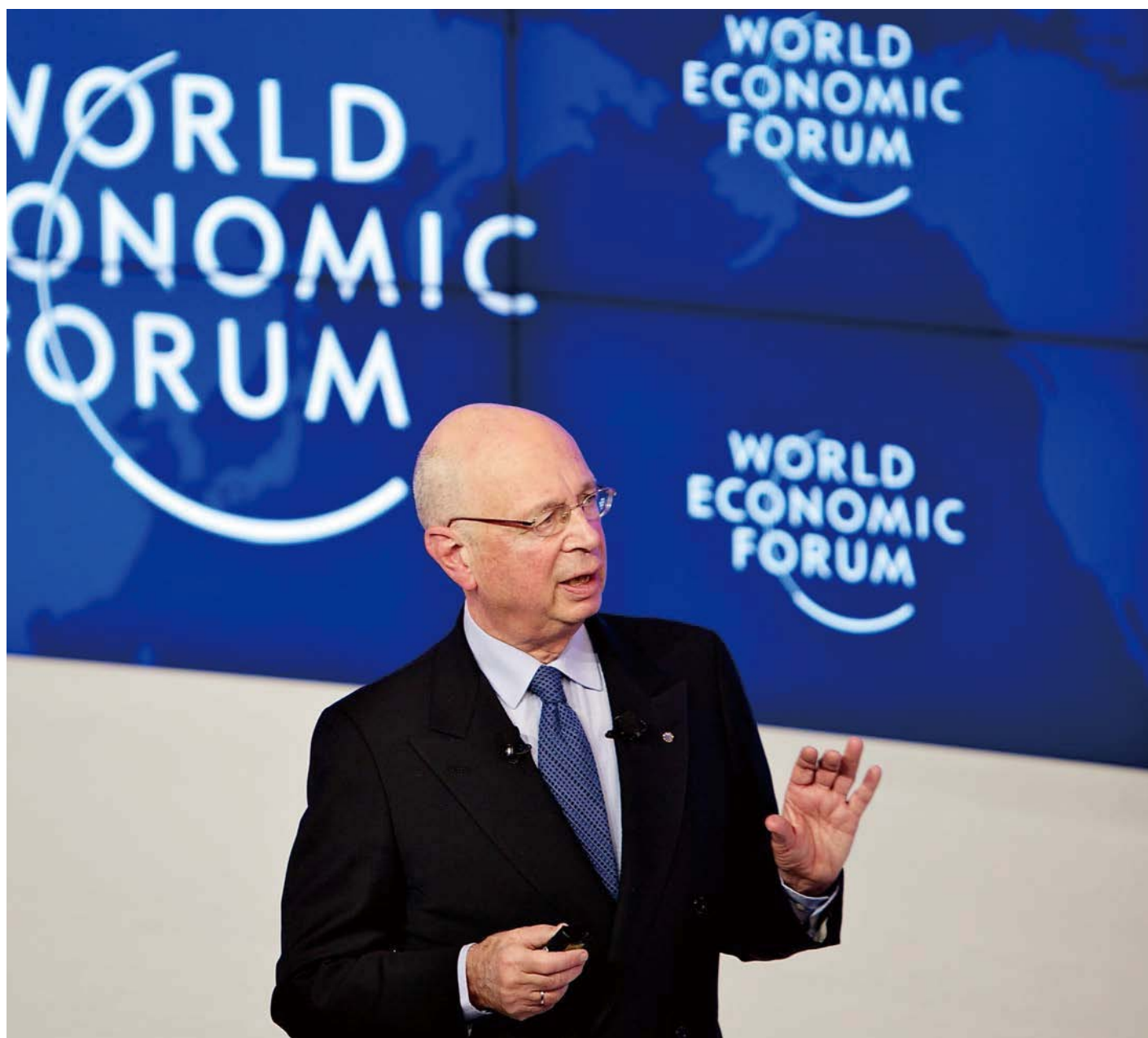
克劳斯·施瓦布（Klaus Schwab） 世界经济论坛创始人兼执行主席

作为深受会员和相关方信赖的合作伙伴，论坛致力于推动并整合全球、地区和行业转型进程。